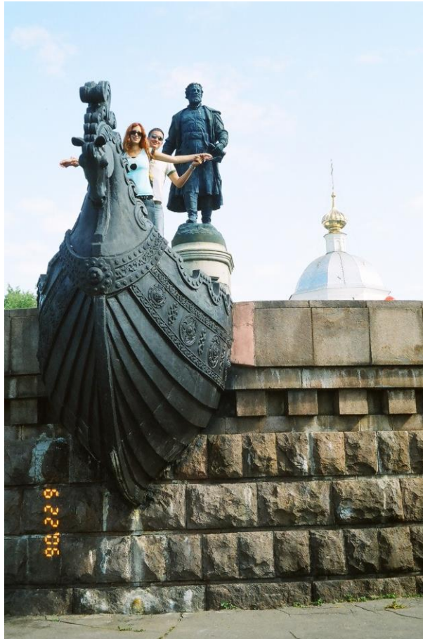
Площадь Мира и памятник "Трех голых людей", как мы его называли, были все теми же.