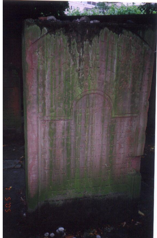
Рав Цви Гирш Горовиц

Стрелки часов неумолимо движутся вперед, близится час закрытия музея. С трепетом запираю тяжелые железные ворота. Читаю имена погибших в Катастрофе, выгравированные на металлических табличках, прикрепленных к ограде. Бросаю взгляд на возвышающийся среди молодых кленов куб, собранный из обломков бывшей на этом месте синагоги, и направляюсь в сторону вокзала.