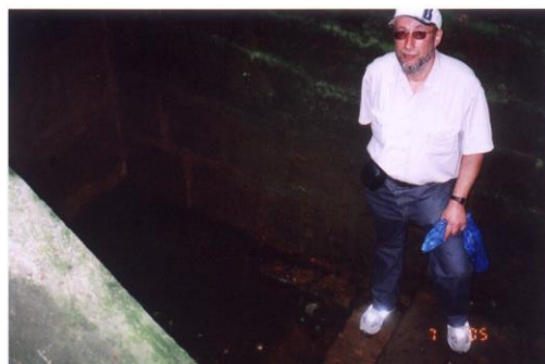
Кёльн: старинная миква

Междугородный экспресс мчал меня через просторы Германии со скоростью 250 км/час к Мюнхену, конечной точке моего маршрута. В вагоне ехали азиаты, турки, арабы. Это была новая Германия, мультинациональная и открытая. Только вот надолго ли? Не явится ли этот этап лишь преходящим явлением, в пору экономических и политических волнений могущий быть снесен волной ненависти и ксенофобии, как это уже не раз бывало в прошлом?