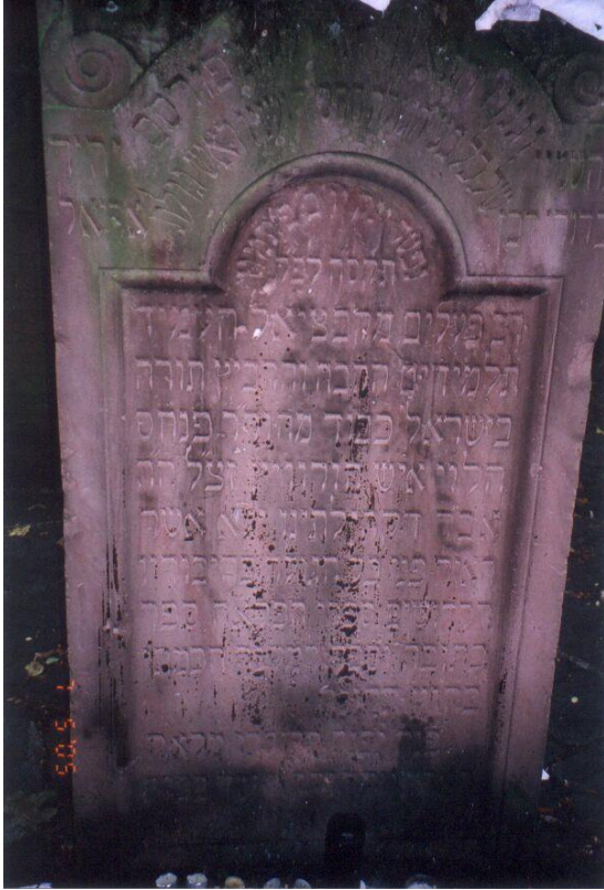
Рав Пинхас Горовиц