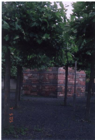
Франкфурт: в память о Judengasse

Стрелки часов неумолимо движутся вперед, близится час закрытия музея. С трепетом запираю тяжелые железные ворота. Читаю имена погибших в Катастрофе, выгравированные на металлических табличках, прикрепленных к ограде. Бросаю взгляд на возвышающийся среди молодых кленов куб, собранный из обломков бывшей на этом месте синагоги, и направляюсь в сторону вокзала.