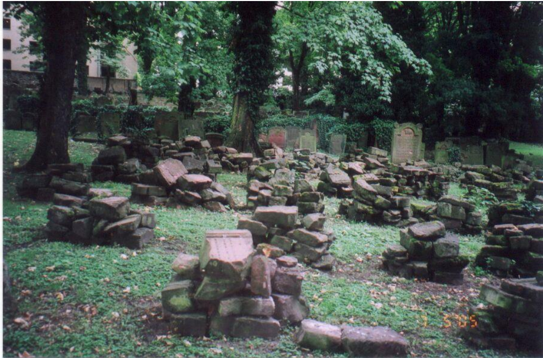
Старое еврейское кладбище Франкфурта

Медленно подхожу к потемневшим от времени плитам. Много свечей, записок, как у западной стены в Иерусалиме. Надписи на памятниках местами стерты, но все же удается прочесть: